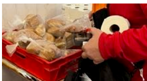
ÅRET NÄR BEHOVET AV HJÄLP ÖKADE SIDAN 2