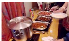
JULFIRANDET PÅ STADSMISSIONEN SIDAN 4