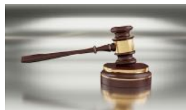
VAD HÄNDE PÅ ÅRSMÖTET? SIDAN 2