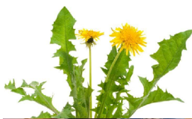
SOMMAREN PÅ STADSMISSIONEN SIDAN 4