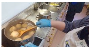
POPULÄR PALTFFEST SIDAN 3